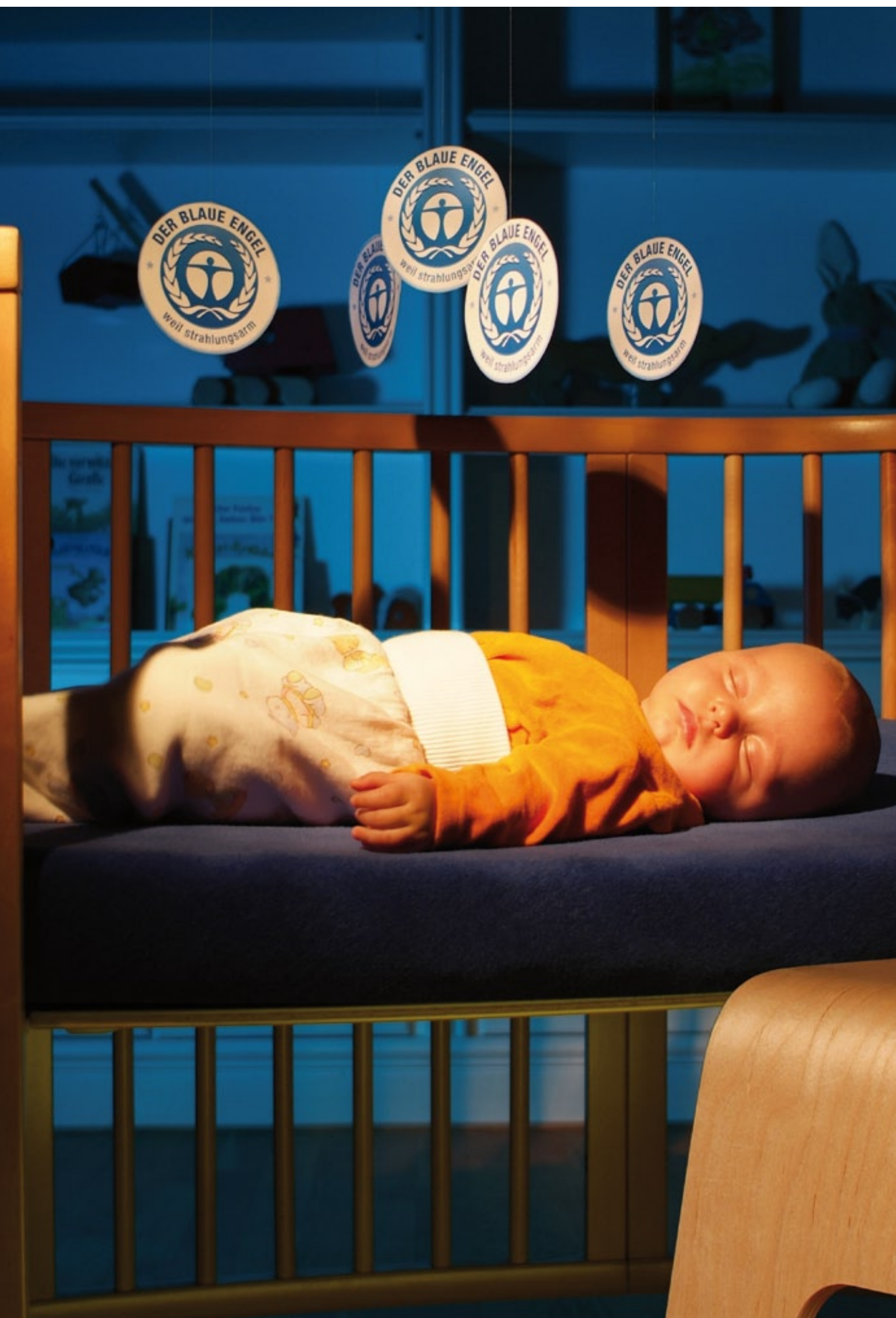
Blauer Schutzengel für Babys Schlaf. Umweltzeichen jetzt auch für strahlungsarme und energieschonende Babyüberwachungsgeräte. Blue Guardian Angel for baby's sleep. The Environmental Label now available for low radiation and energy saving baby monitors.